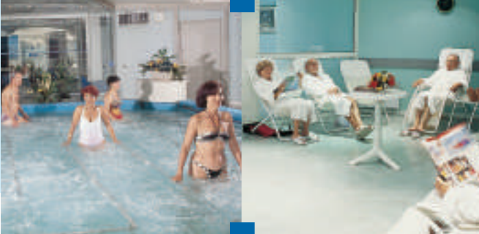
Salle de repos